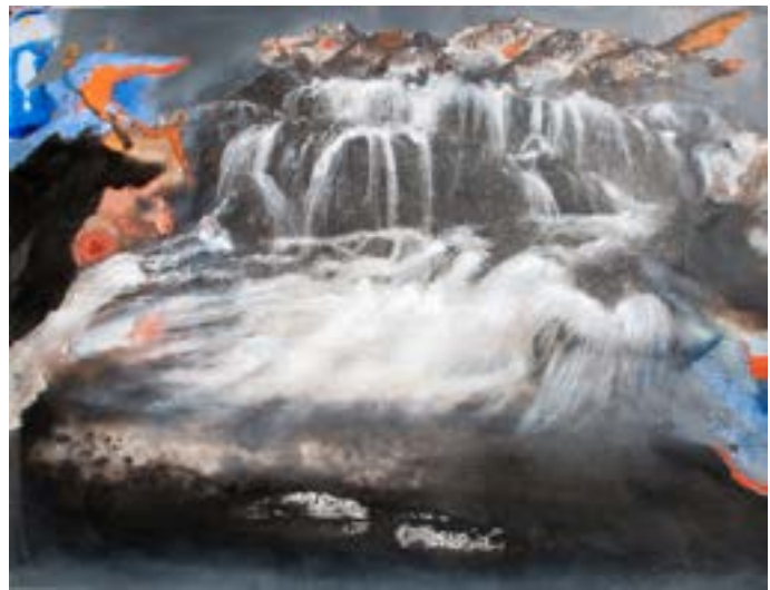
2. Nicole King, Passage au noir, (la Cascade) , 2016. Technique mixte. 50x65 cm