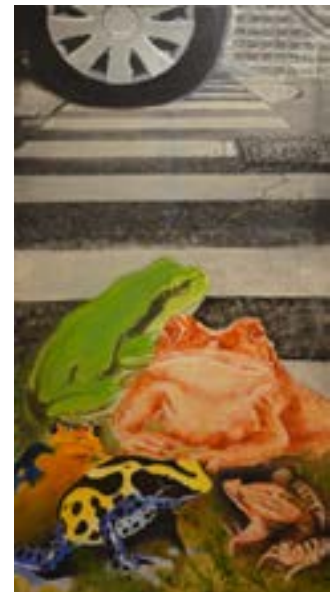
1. Nicole King, Triste passage (ou la Disparition des batraciens) , 2018. Technique mixte, report photo. 120x60 cm

Nicole King présentera une sélection de toiles correspondant à sa recherche esthétique sur l'eau douce sur les 20 dernières années . La sécheresse qui sévit en France pour la 2e année consécutive, avec 70 % des nappes phréatiques à un niveau inférieur à la norme*, démontre combien, même dans les régions tempérées, l'eau douce est une ressource en tension. Elle est précieuse, doit être économisée, et les milieux aquatiques comme leur biodiversité doivent être mieux compris et protégés. Les nappes et les eaux de surface contaminées par la pollution, notamment par les polluants éternels, les PFAS et les résidus de pesticides portent atteinte à la santé humaine**. Les changements sociétaux en cours – par exemple concernant la lutte contre la pollution plastique, pour laquelle un traité mondial est actuellement discuté à l'ONU – demeurent bien lents face à l'urgence ! La démarche interdisciplinaire, entre art et science, que Nicole King porte depuis plus de 40 ans, veut contribuer à créer de nouvelles formes de représentation afin de stimuler la mise en place des « changements transformateurs » pour la société, réclamés notamment par les experts de l'IPBES (Plateforme intergouvernementale scientifique et politique sur la biodiversité et les services écosystémiques). *Source BRGM, juin 2023. ** Campagne nationale de mesure de l'occurrence de composés émergents dans les eaux destinées à la consommation humaine, Anses, mars 2023.